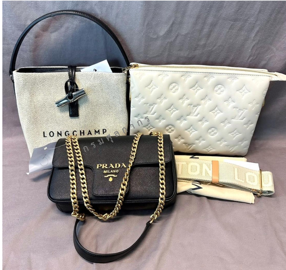
รวม 3 รายการ

ยี่ห้อ PRADA ขนาด 22x15 ซม. และยี่ห้อ LONGCHAMP ขนาด 17x20 ซม.